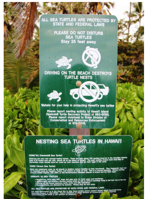
La sensibilisation du public commence par une signalétique abondante et détaillée